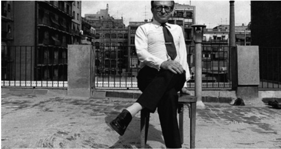
En Calders, al terrat de l'Editorial Montaner i Simón, on treballava en tornar de l'exili. Ara hi ha un núvol de ferralla

Doncs bé, sorprenentment la Banca Jofresa va funcionar, d'una forma tan absurda com la impremta que regalava en Fernández.