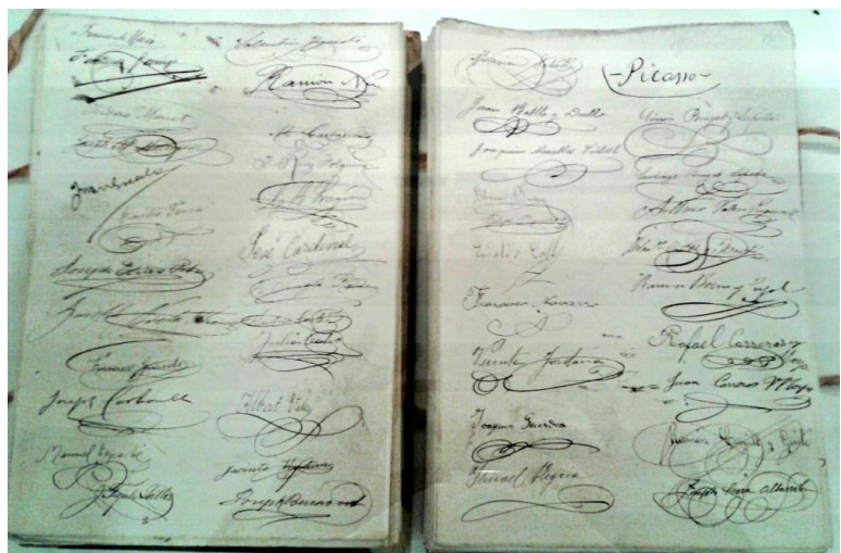
Llibre de condol de Mossèn Cinto de l'Ajuntament de Sarrià, amb la signatura inconfusible de Picasso, que pot veure's a la Vil·la Joana

La nit del 10 de juny de 1902, un prometedor artista que no havia cabut al cotxe d'en Ramon Casas (on hi anaven en Rusiñol, l'Isaac Albéniz i l'Utrillo: en Pere Romeu s'havia hagut de quedar als 4 Gats, no com al quadre), va haver de pujar a peu sota una pluja intensa des del carrer de Montsió fins a Vallvidrera. Va arribar-hi a l'alba, amb un pomell de flors silvestres collides en el trajecte. Havia mort Mossèn Cinto, i Catalunya va quedar en xoc. El jove Pablo Ruiz va llençar les flors al fèretre quan el seguici va sortir de la Vil·la Joana: L'enterrament de Verdaguer ha estat probablement la més impressionant manifestació de dol que es recorda a la ciutat i el país, i Picasso hi va ser a primera línia.